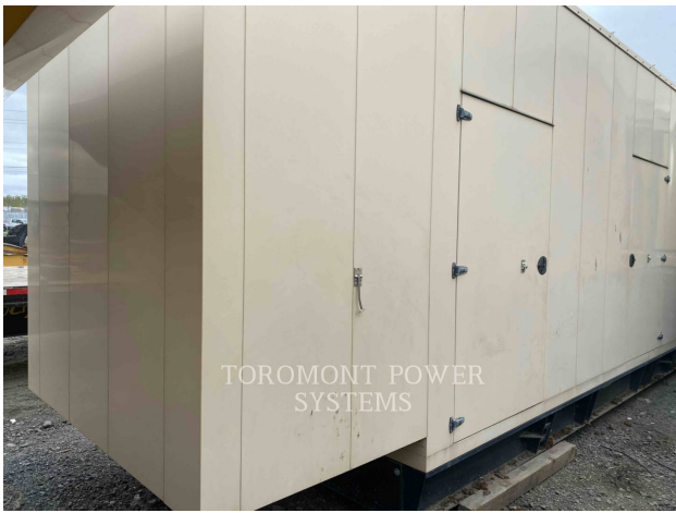
TOROMONT POWER SYSTEMS