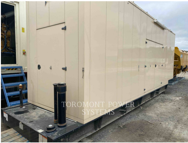
TOROMONT POWER SYSTEMS