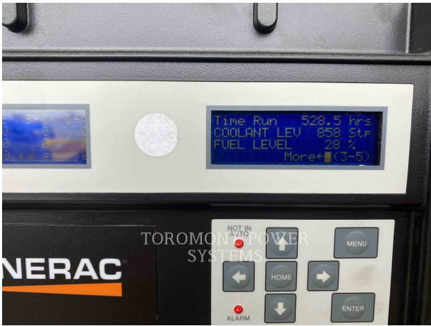
TOROMONT POWER SYSTEMS

Time Run 528.5 hrs COOLANT LEV 858 Stp FUEL LEVEL 28 % Moret (3-5)