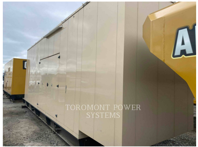
TOROMONT POWER SYSTEMS