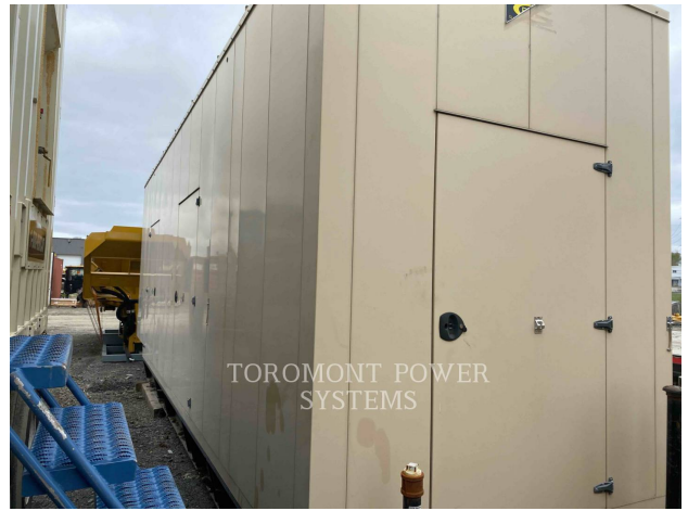
TOROMONT POWER SYSTEMS